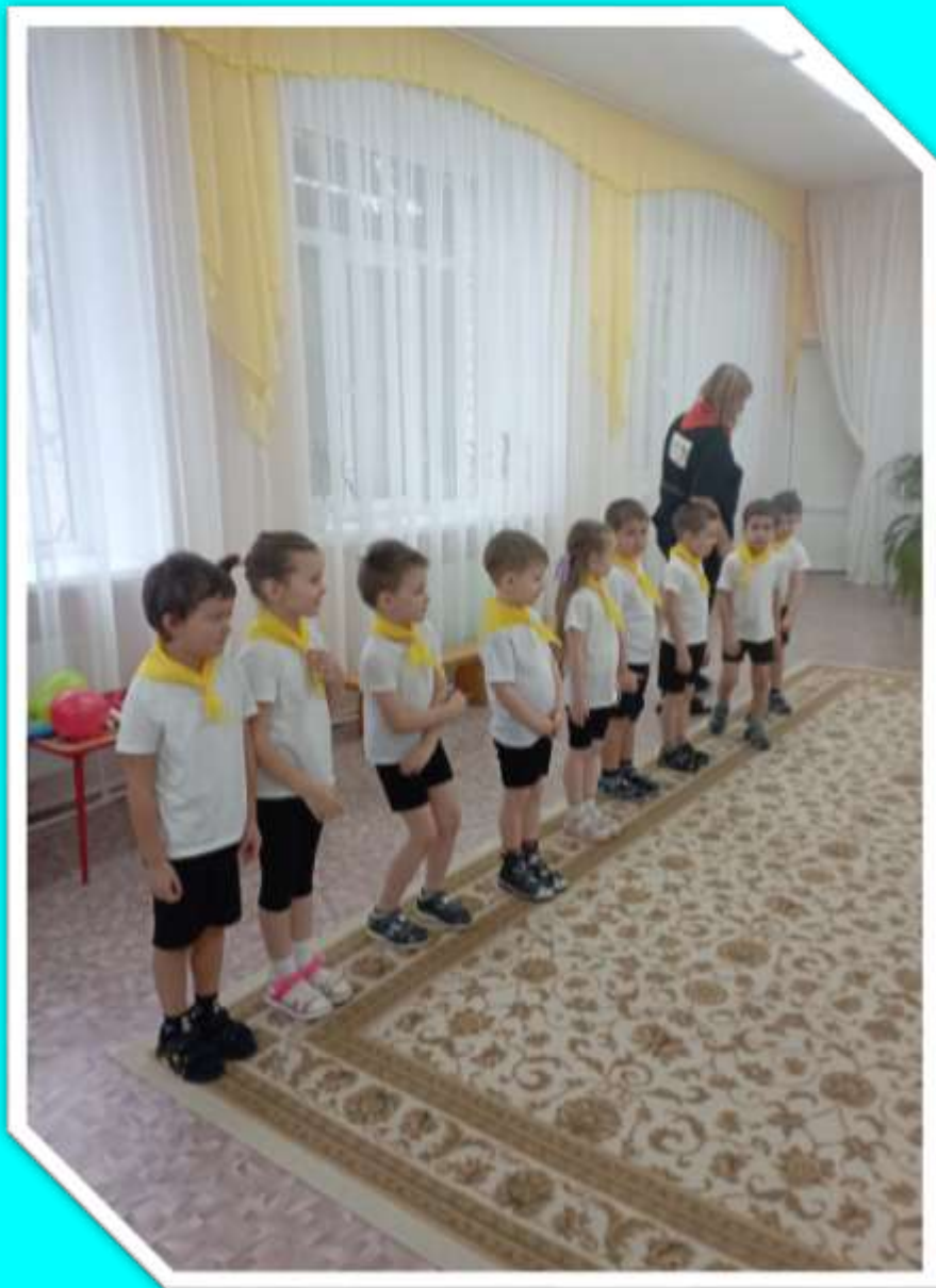
Команда группы № 8 «Желтый огонёк»