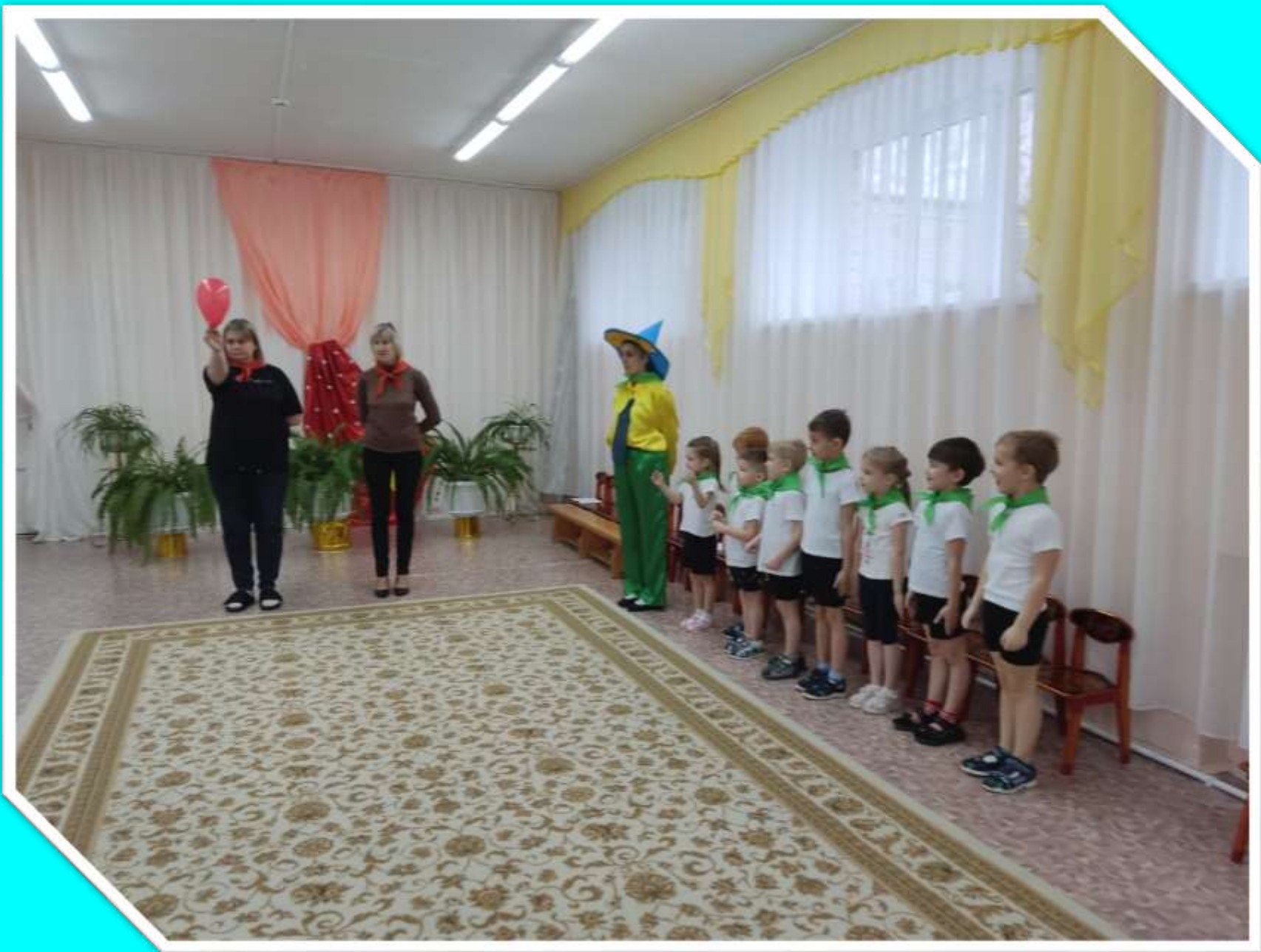
Игра на внимание «Сигналы светофора»