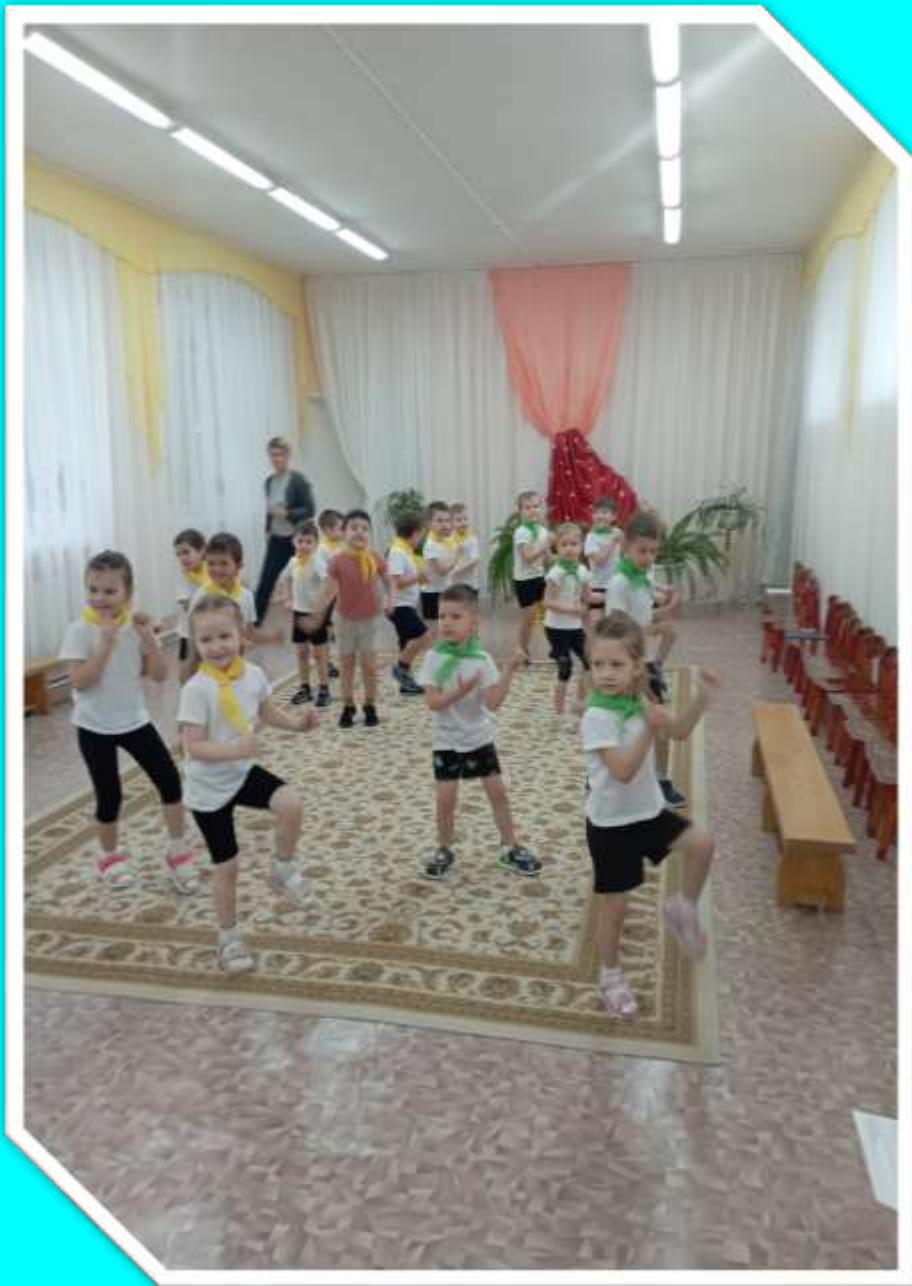
Флеш-моб «Соблюдай ПДД и дружи с ГИБДД»