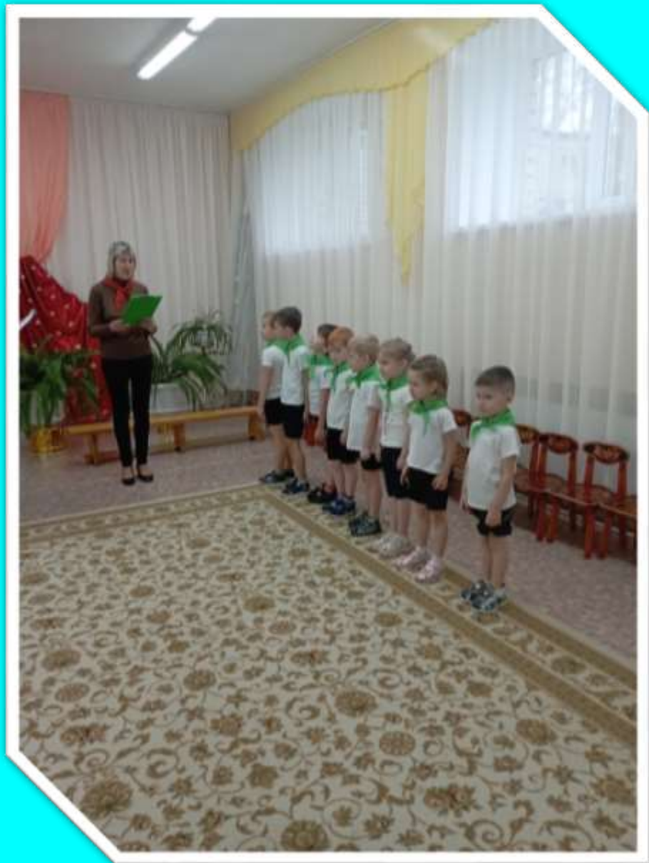
Команда группы №4 «Зелёный огонёк»