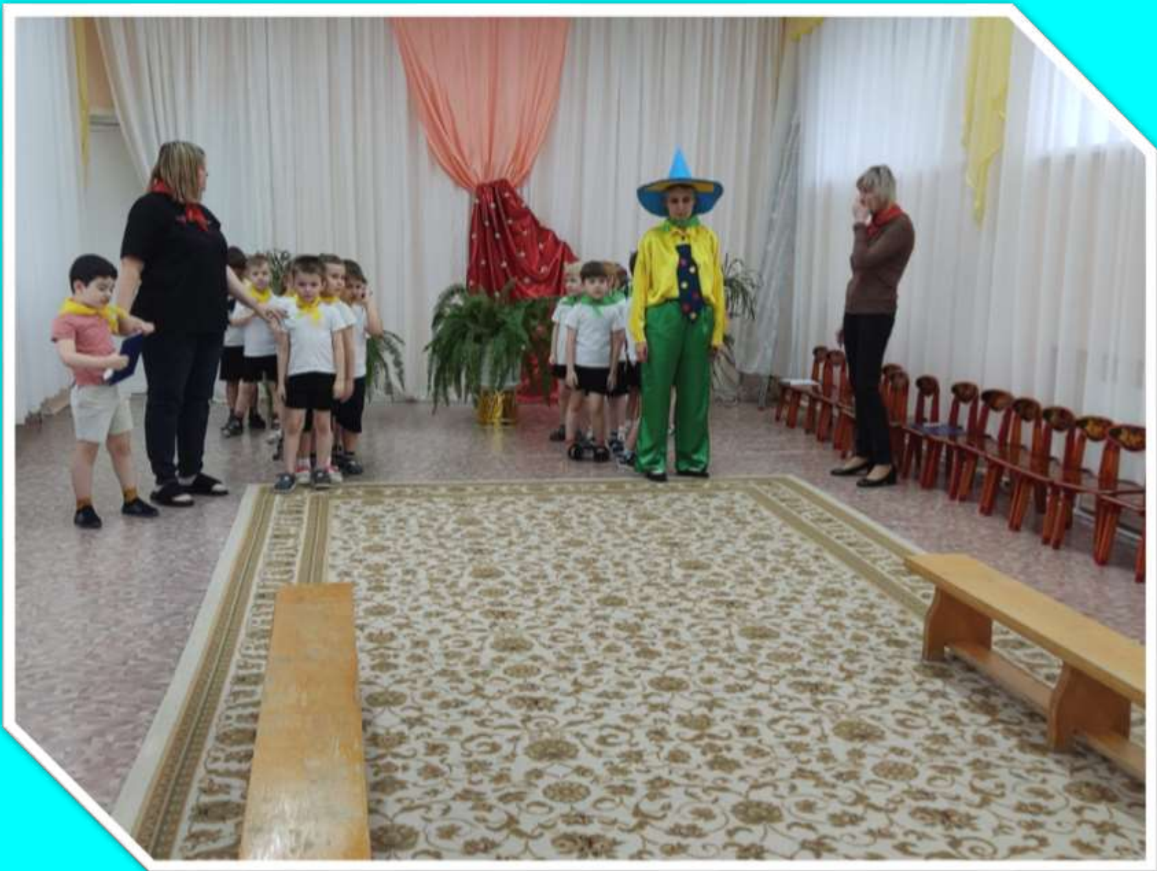
Эстафета «Сядь в автобус».