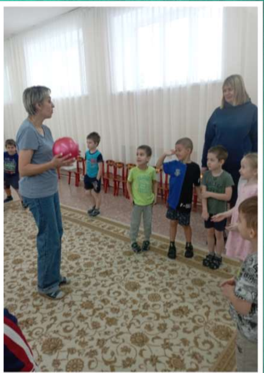
Игра «На земле, в воздухе, на земле»