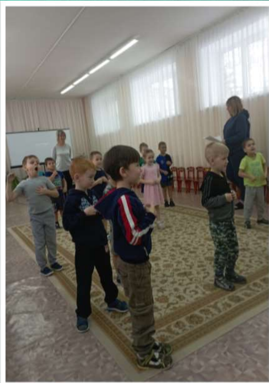
Игра «Угадай, что делает ведущий»