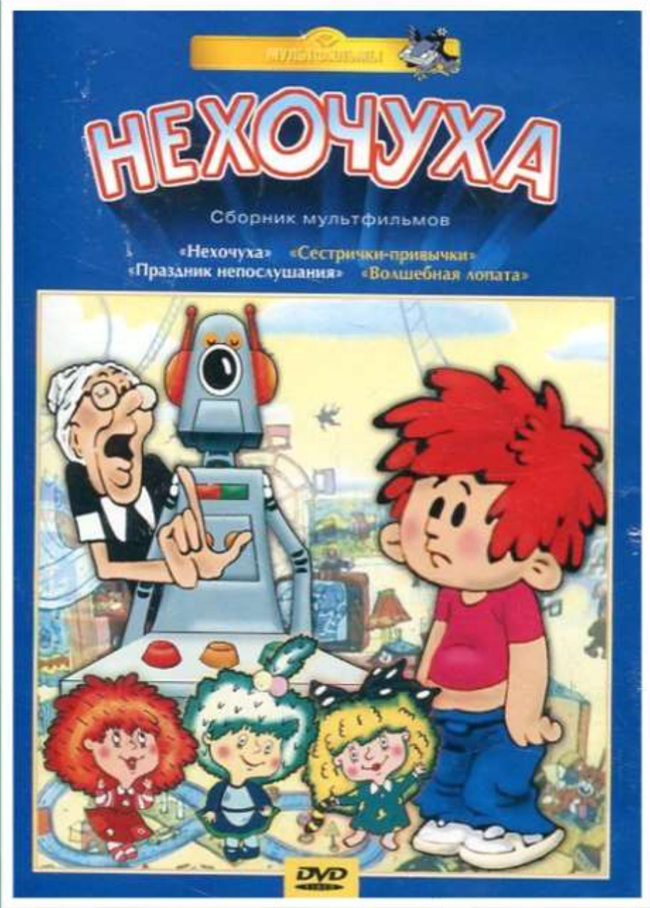
Просмотр мультфильма «Нехочуха»